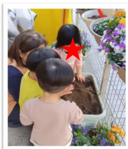
←種芋を植えています🍷