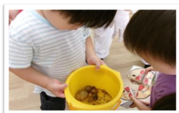
↑収穫したお芋を見えています👀

みなさん、 ほどじゃ をご存じですか？ 保土ヶ谷区はじゃがいもの産地、保土ヶ谷で作られているじゃがいもは ほどじゃ と呼ばれています。 ピア・ピアの子どもたちも2歳児さんを中心に ほどじゃ を育てています♪（栽培時期は毎年変わります）